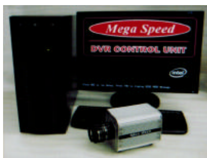
MS30K DVR 4D Desktop