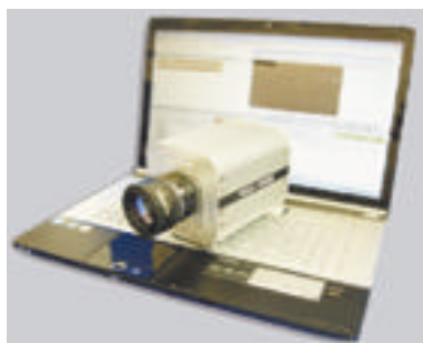
MS30K DVR Mini