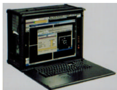
MS30K DVR 4S